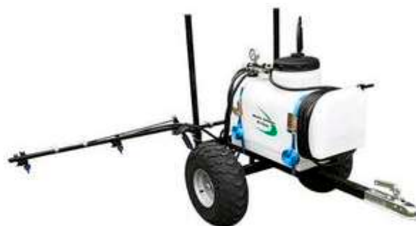
Tracteur Massey Ferguson 25, autour des années 1970 et son petit pulvérisateur (image moderne)